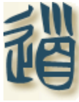
Caractère de petite écriture